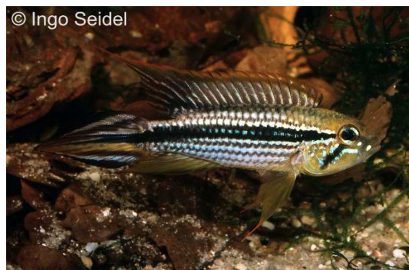
Adultes Männchen von Apistogramma agassizii "Tefé"