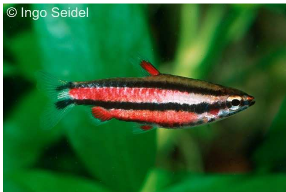
Erwachsenes Männchen des Purpur-Zwergziersalmlers

Während der Purpur-Ziersalmler ( Nannostomus mortenthaleri ) nahezu das gesamte Jahr über bei aqua-global verfügbar ist, importieren wir den noch etwas kostspieligeren Nannostomus rubrocaudatus nur recht selten. Derzeit haben wir diesen überaus attraktiven Zwergziersalmler aus Peru, der recht nah mit Nannostomus marginatus verwandt zu sein scheint, wieder im Angebot. Nur die Männchen bilden bei dieser Art eine sehr attraktive Rotfärbung aus und sind verglichen mit N. mortenthaleri nur wenig revierbildend. Die Tiere erreichen eine Länge von etwa 30-35 mm und sind ganz ähnlich wie andere Nannostomus -Arten recht unproblematische Aquarienfleglinge, die selbst mit Trockenfutter zu ernähren sind.