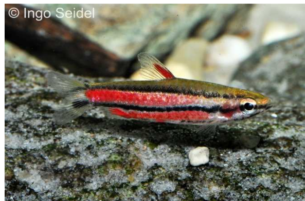
Junger Nannostomus rubrocaudatus