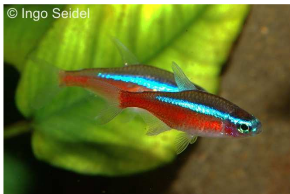
Der Roter Neon aus dem Orinoko-Gebiet in Kolumbien

Unsere letzten Newsletter sowie die aktuellen Stocklisten finden Sie auf unserer neuen Homepage www.aqua-global.de ! Zur Ansicht der Preislisten benötigen Zoofachhändler ein Passwort, das Sie bei uns anfordern können.