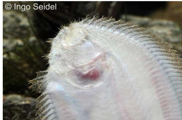
Unterseite der sogenannten „Peru-Süßwasserflunder“