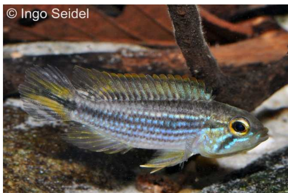
Junger Agassiz' Zwergbuntbarsch vom Rio Tefé

Der Agassiz' Zwergbuntbarsch ist in der roten Variante einer der am häufigsten gepflegten Zwergbuntbarsche der Gattung Apistogramma . Von dem im Amazonasbecken von Brasilien bis nach Peru verbreiteten Apistogramma agassizii sind diverse Farb- und Fundortvarianten bekannt, die sich farblich recht stark unterscheiden können. Die blau gestreifte Fundortvariante vom Rio Tefé ist unverwechselbar gefärbt, wird aber nur selten importiert. Deshalb sind wir sehr glücklich, Ihnen nun eine größere Anzahl junger Tiere anbieten zu können. Die Pflege dieser Tiere, die eigentlich Schwarzwasserfische sind, sollte in nicht zu hartem Wasser bei 25-29 °C erfolgen.