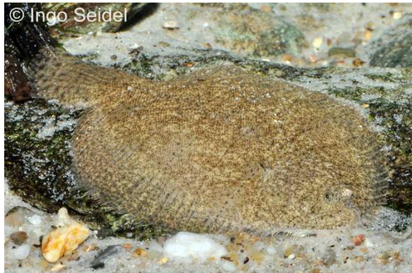
Hypoclinemus mentalis ist eigentlich eine Zunge

Hypoclinemus mentalis ist der am häufigsten aus Südamerika importierte Plattfisch. Er wird gewöhnlich als „Süßwasserflunder“ angesprochen, was jedoch nicht ganz richtig ist. Zwar ist es in der Tat ein reiner Süßwasserfisch, aber bei den Vertretern der Familie Achiridae, der diese Fische angehören, handelt es sich um amerikanische Zungen und nicht um Flundern. Da sich dieser Name jedoch eingebürgert hat, verwenden auch wir ihn weiterhin so. Etwa 20-25 cm Länge können diese Plattfische, die nicht schwierig zu pflegen sind, erreichen. Grundvoraussetzung für das Wohlbefinden ist jedoch ein feiner Bodengrund, in den sich die Tiere gerne von Zeit zu Zeit vergraben. „Süßwasserflundern“ lassen sich problemlos mit Frost- und Lebendfutter ernähren (Leibspeise ist Tubifex), nach Gewöhnung sogar mit Trockenfutter.