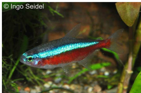
EU-Nachzucht des Roten Neons ( P. axelrodi ) aus Brasilien

Allerdings unterscheiden sich die Roten Neons aus dem Orinoko durch einen deutlich kürzeren blauen Streifen von den brasilianischen Tieren, weshalb wir sie als Paracheirodon cf. axelrodi bezeichnen. Wir bieten außer den sehr preiswerten Roten Orinoko-Neons schon seit einiger Zeit auch sehr stabile EU-Nachzuchten der brasilianischen Roten Neons an. So müssen Sie auch trotz immer seltener werdender Importe aus Manaus nicht auf diese hübschen Roten Neons verzichten.