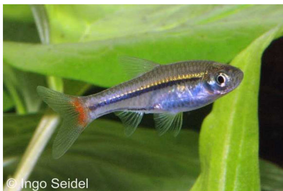
Brillant-Rotschwanzbärbling ( Rasbora borapetensis )