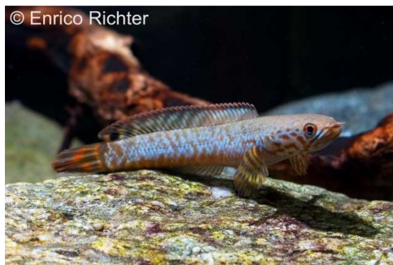
Bleher's Regenbogenschlangenkopf ( Channa bleheri )