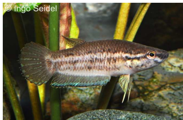
Weibchen von Betta simplex