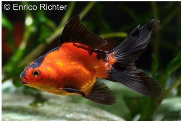
Schleierschwanz der Zuchtform „Ryukin rot-schwarz“