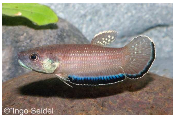
Männchen des Krabi-Kampffisches

Von einem deutschen Züchter erhielten wir nun mal wieder einen hübschen maulbrütenden Kampffisch, der recht selten im Handel auftaucht. Diese ursprünglich aus Thailand stammende Art erreicht eine Maximallänge von etwa 8 cm. Charakteristisch für die Männchen ist eine intensiv blau, schwarz und weiß gesäumte Afterflosse und untere Schwanzflosse. Die etwas unscheinbareren Weibchen weisen eine Streifenzeichnung auf. Betta simplex ist sogar in Leitungswasser zu pflegen und wenn dieses nicht zu hart ist, auch darin recht einfach zu vermehren. Das Männchen ist bei dieser Art für die Maulbrutpflege zuständig. Die Art sollte mit Lebend- oder Frostfutter ernährt werden.