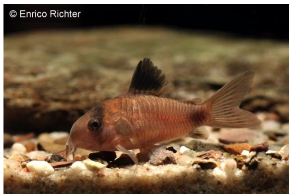
Rotäugige Zuchtform des Panda-Panzerwelses

Eine sehr ungewöhnliche Zuchtform des Panda-Panzerwelses erhielten wir vor kurzem von einem osteuropäischen Lieferanten. Auch wenn das auf der beigefügten Abbildungen nicht zu erkennen ist, handelt es sich bei den Tieren um rotäugige Exemplare. Bei diesen Fischen fehlt jedoch die dunkle Zeichnung nicht völlig sondern nur partiell. So sind die dunkle Augenbinde und der Schwanzfleck deutlich reduziert. Alles in allem handelt es sich um eine interessante neue Zuchtform, die bislang noch nicht in Erscheinung getreten war. In den Ansprüchen stimmen diese Fische natürlich völlig mit der Wildform überein.