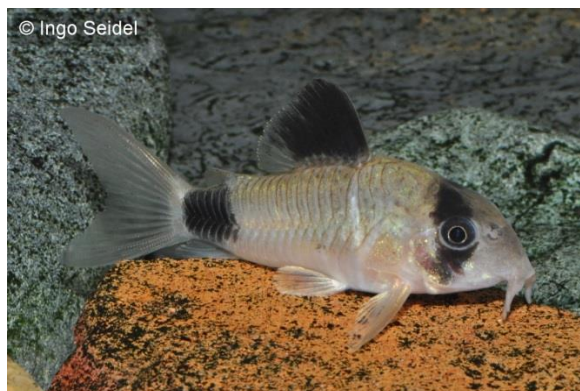
Zum Vergleich: Wildform von Corydoras panda