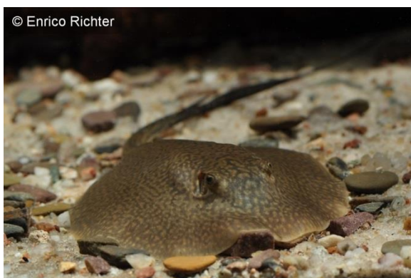
Langschwanz-Süßwasserrochen ( Potamotrygon reticulatus )

Regelmäßig werden wir von Zoofachhändlern nach klein bleibenden Süßwasserrochen gefragt und wir müssen leider immer wieder sagen, dass es wirkliche Zwerge unter diesen Fischen leider nicht gibt. Einen der kleinsten bekannten Vertreter haben wir jedoch regelmäßig im Angebot, den Langschwanz-Süßwasserrochen, der in der Aquaristik als Potamotrygon reticulatus angesprochen wird, auch wenn diese Bezeichnung seitens der Wissenschaft als Synonym zu P. orbignyi angesehen wird. Diese recht attraktiv genetzten Rochen erreichen nur einen Scheibendurchmesser von maximal etwa 35 cm und sind somit durchaus für die Aquaristik geeignet.