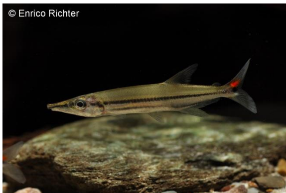
Längsstreifen-Hundssalmmler ( Acestrorhynchus isalineae )

Einen der attraktivsten und kleinsten Vertreter der Hundssalmmler konnten wir nun nach langer Zeit mal wieder aus Peru importieren. Der Längsstreifen-Hundssalmmler ( Acestrorhynchus isalineae ) ist im Oberlauf des Amazonas in Brasilien und Peru beheimatet und erreicht nur eine Länge von 11-12 cm. Aufgrund ihrer geringen Größe sind diese Räuber durchaus gesellschaftsfähig und können beispielsweise gut gemeinsam mit Kirschflecksalmmlern oder südamerikanischen Buntbarschen gepflegt werden. Außer kleine Fische fressen sie auch problemlos anderes größeres Lebendfutter, wie z.B. lebende weiße Mückenlarven. Die dauerhafte Pflege sollte bei 24-29 °C in weichem bis mittelhartem Leitungswasser erfolgen.