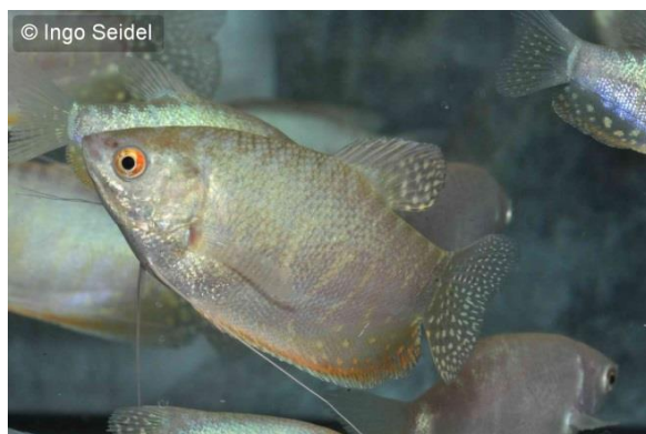
Platin-Fadenfisch ( Trichogaster trichopterus )

Der Fadenfisch Trichogaster (neuerdings Trichopodus ) trichopterus tritt in der Aquaristik in vielen Gewässern in Erscheinung. Ständig haben wir diese Art als Goldfadenfisch, Blauen Fadenfisch oder Marmorfadenfisch im Angebot. Derzeit haben wir von einem deutschen Züchter sogenannte Platin-Fadenfische verfügbar. Diese Tiere besitzen eine hübsche leuchtend weiße Färbung. Wir bieten diese neue Zuchtform in einer Größe von 5-7 cm an.