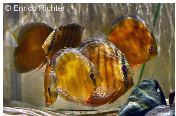
Blauer Diskusfisch ( Symphysodon aequifasciatus )