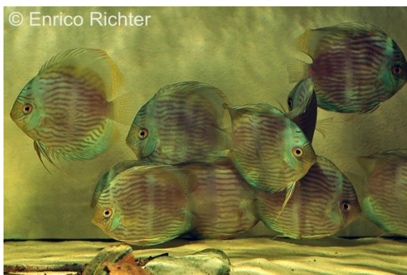
Blauer Heckel-Diskus ( Symphysodon discus )

Aus dem Amazonasgebiet in Brasilien erhielten wir mal wieder sehr schöne Wildfänge des Blauen sowie des Heckel-Diskusfisches. Die Blauen Diskus ( Symphysodon aequifasciatus ) haben eine Größe von 14-16 cm und sollen aus dem Rio Nhamunda, einem nördlichen Zufluss des Amazonas stammen. Die Heckel-Diskus ( Symphysodon discus ) zeigen eine wunderschöne blaue Zeichnung und wurden im Rio Unini, einem Zufluss zum Rio Negro, gefangen. Sie sind 12-14 cm groß. Die Pflege dieser Diskus-Wildfänge sollte in weichem bis mittelhartem Wasser bei 26-30 °C erfolgen. Problemlos ließen sich unsere Tiere an die Aufnahme von Weißen Mückenlarven gewöhnen, mit denen wir sie deshalb derzeit auch füttern.