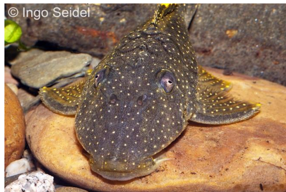
Baryancistrus sp. L 081 „Stardust“ oder „Spezial II“