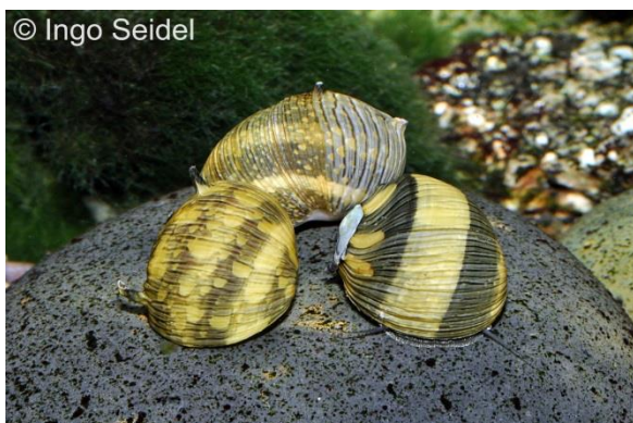
Geweisschnecke, Multicolor ( Clithon diadema )

werden, da sie eine sonnenähnliche Musterung aufweisen. Die Schnecken haben eine Größe von 1-2 cm. Da die Larven der Clithon ins Meer verdriftet werden und sich nur in Meerwasser entwickeln können, dürfte sich die Vermehrung dieser Schnecken im Aquarium als schwierig gestalten.