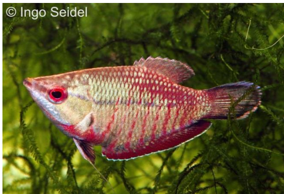
Weibchen des Roten Schokoladenguramis ( Sphaerichthys vaillanti )

Der zweifellos schönste Vertreter der sogenannten Schokoladenguramis ist Sphaerichthys vaillanti . Der Rote Schokoladengurami gelangt aus West-Kalimantan, dem indonesischen Teil der Insel Borneo, zu uns, wo sie in Gewässern vom Schwarzwassertyp vorkommt. Zur dauerhaften Pflege empfiehlt sich auf jeden Fall weiches und saures Wasser mit einem pH-Wert unter 6 und die Verfütterung von Lebend- oder Frostfutter. Die Unterscheidung der Geschlechter ist bei eingewöhnten Tieren einfach, denn nur die Weibchen entwickeln die spektakuläre rote Färbung, wohingegen die Männchen, die Maulbrutpflege betreiben, braun bleiben.