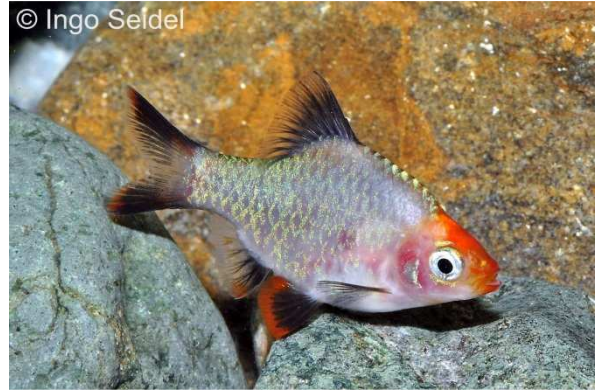
Diese Zuchtform heißt „Red Devil“