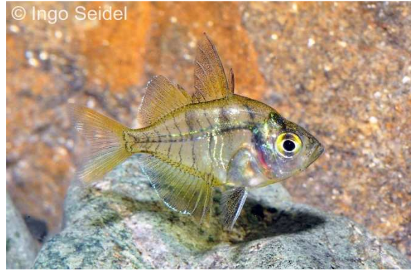
Der Dukaten-Glasbarsch Parambassis lala