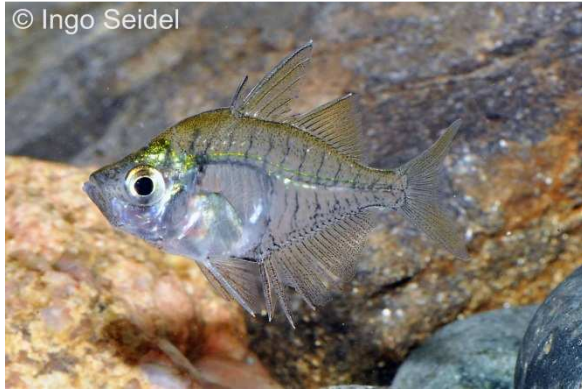
Der echte Indische Glasbarsch Parambassis ranga