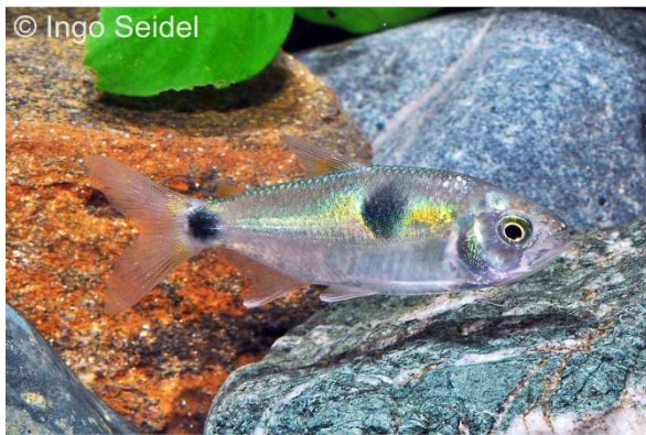
Exodon paradoxus aus Kolumbien

Aus Kolumbien importierte aqua-global wieder einmal eine größere Anzahl der hübschen Zweitupfen-Raubsalmler. Diese etwa 8-9 cm groß werdenden Salmler sind eine wahre Zierde für größere Aquarien. Allerdings handelt es sich nicht gerade um friedliche Fische für ein normales Gesellschaftsaquarium, da sie gerne kleineren Fischen Schuppen und Flossenteile stehlen oder sie gar fressen. Exodon sind eher gute Beifische für große Cichliden oder Welse.