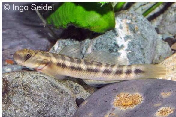
Die Algengrundel Sicyopterus japonicus

Aus Taiwan importierte aqua-global nun zum ersten Mal eine interessante Grundel, die sich in der Natur nur vom Algenaufwuchs auf den Steinen ernährt. Auch im Aquarium weiden diese Fische Grün- und Kieselalgenbeläge auf glatten Flächen ab. Darüber hinaus sollten die Tiere jedoch mit pflanzlichem Trockenfutter ernährt werden. Sicyopterus japonicus fühlt sich in Süß- und Brackwasser wohl und dürfte sicherlich eine Länge von etwa 8-10 cm erreichen.