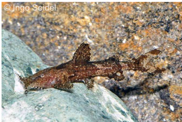
Pseudolaguvia ferruginea aus Indien

Schon seit geraumer Zeit erhalten wir von Zeit zu Zeit Beifänge einer kleinen Gebirgswels-Art aus Indien, die offensichtlich gemeinsam mit den ähnlichen Deltaflügel-Zwergwelsen ( Hara jerdoni ) vorkommen. Nun erhielt aqua-global erstmalig eine ganze Sendung dieser nur 2-3 cm großen Fische. Es handelt sich dabei um Pseudolaguvia ferruginea , einem Vertreter der südostasiatischen Gebirgswelse der Familie Erethistidae. Aufgrund einer zu erwartenden Endgröße von nur 3-4 cm, eignen sich diese Welse perfekt für kleinere Aquarien. Gerne verbergen sie sich in Pflanzen oder graben sich auch schon einmal in feinen Sandboden ein. Bevorzugt wird feines Lebend- und Frostfutter, aber auch Trockenfutter wird nicht verschmäht.