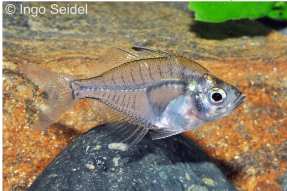
Der wohl häufigste Glasbarsch ist Parambassis siamensis